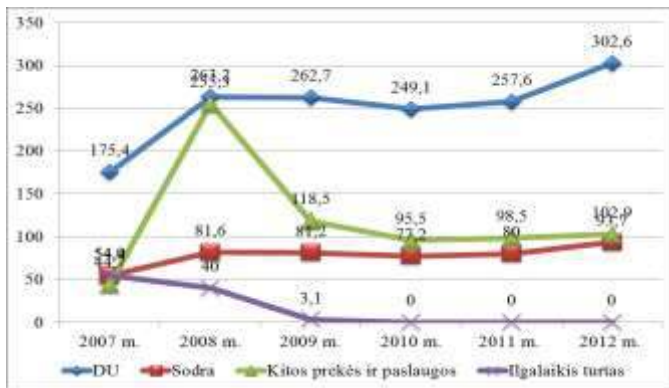
2 pav. Lėšų skirtų veiklai, pagal išlaidų paskirtį pokytis 2007-2012 m. (tūkst. Lt).

Išlaidos skirtos darbo užmokesčiui ir veiklai, lyginant su 2010 m., padidėjo, nes buvo priskirta Biurui funkcija – sveikatos priežiūros ikimokyklinio ugdymo įstaigose organizavimas (2 pav.). 2012 m. lėšų skyrimas iš valstybės biudžeto sumažėjo 900 litų. Privalomojo sveikatos draudimo fondo biudžeto lėšos nekito (3 pav.). 80 proc. įstaigos išlaidų sudarė išlaidos skirtos darbo užmokesčiui ir socialinio draudimo fondo mokesčiams, o įstaigos patalpų išlaikymui ir veiklai – 20 proc.